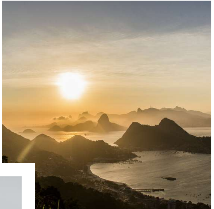
Parque da Cidade

Nas marcações de praias, o destaque vai para Camboinhas e Itacoatiara, com 10 fotos, cada.